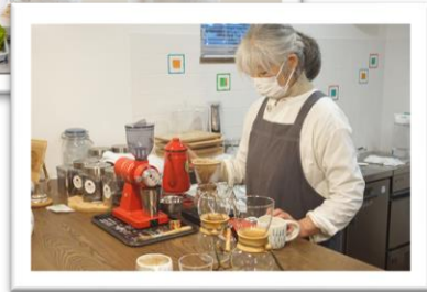
幅広い年代の方が学生として 在籍・卒業しています。